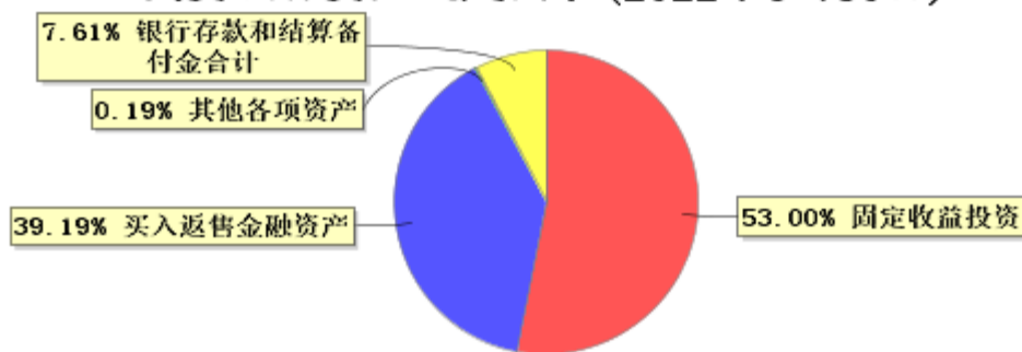
投资组合资产配置图表(2022年6月30日)

● 固定收益投资 ● 买入返售金融资产 ● 其他各项资产 ● 银行存款和结算备付金合计